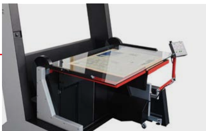
Umfangreiches Sortiment an wechselbaren Aufnahmesystemen für unterschiedlichste Formate