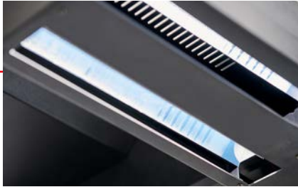
LED-Beleuchtungssystem für reflex- und schattenfreie Ergebnisse