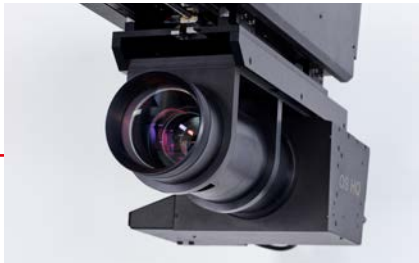
CMOS-GigaPixel-Kamera-system mit optischem Zoom