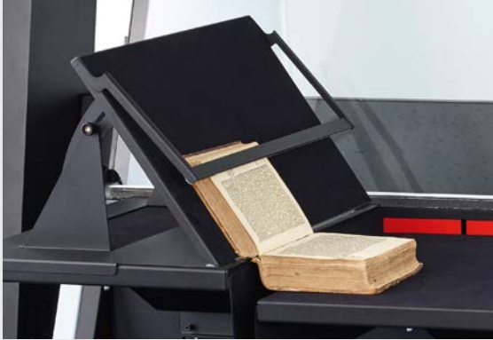
Buchstütze auf Buchwippe OT 180 H 35 XL700