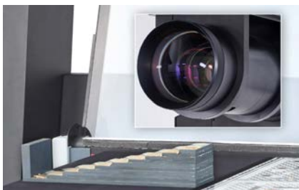
Hohe Tiefenschärfe – mechanisch verstellbare Blende