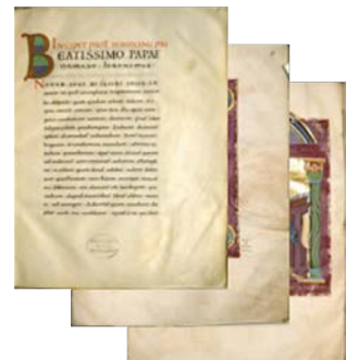
Aus den 2D-Daten macht der ZED 10 3D-Explorer...