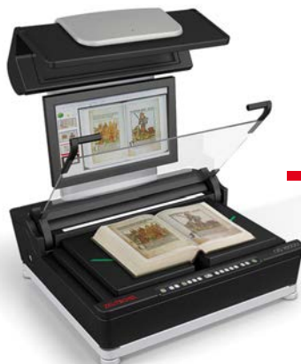
Scannen des Buches mit einem 2D-Scanner