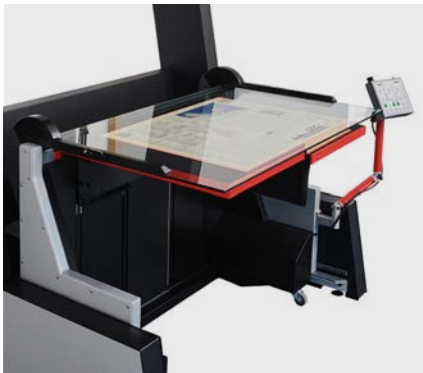
Umfangreiches Sortiment an wechselbaren Aufnahmesystemen