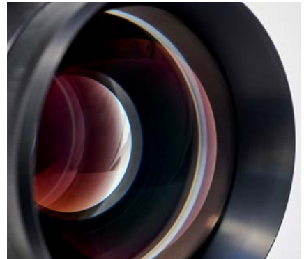
Perfektes Zusammenspiel hochwertiger technischer Komponenten