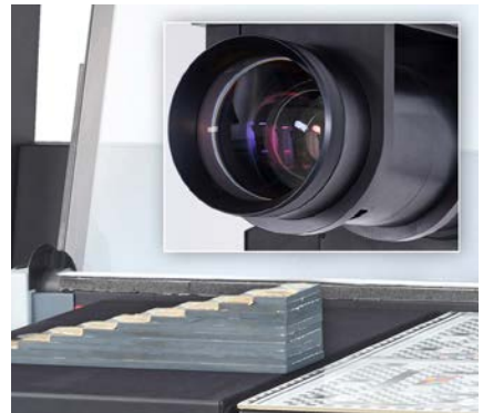
Hohe Tiefenschärfe – mechanisch verstellbare Blende