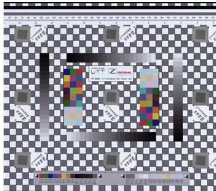
Erfüllt die Standards ISO 19264-1 Level A, Metamorfoze Full und FADGI 4 Star