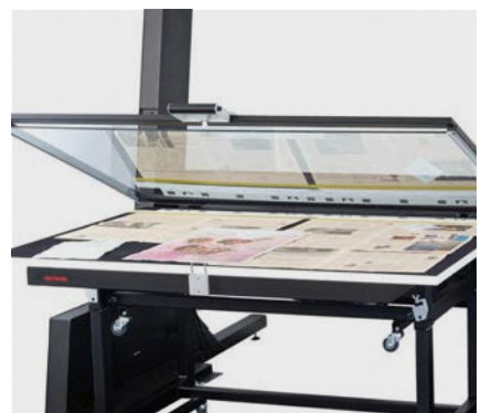
Auflichttisch AT 0 mit geöffneter Glasplatte