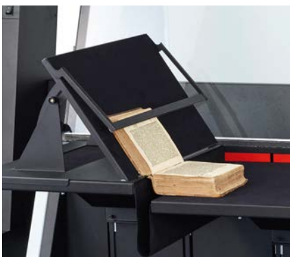
Buchstütze auf Buchwippe OT 180 H 35 XL