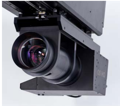
CMOS-GigaPixel-Kamerasystem mit optischem Zoom